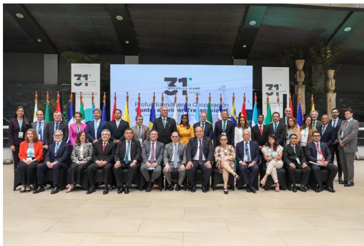
XXXI Asamblea General Ordinaria de la Asociación Iberoamericana de Ministerios Públicos

Cabe anotar, que en esta oportunidad se hace mención que en esta versión ordinaria de la Asamblea General se conmemoran los 70 años de la creación de la AIAMP, que fue fundada en el marco del I Congreso Interamericano del Ministerio Público en Sao Paulo, Brasil, cuyo nombre inicial fue Asociación Interamericana de Ministerios Públicos.