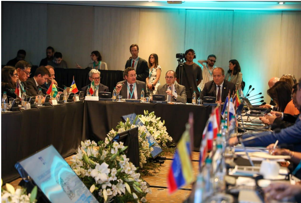
Balance de gestión de la Presidencia en la XXXI Asamblea General Ordinaria de la Asociación Iberoamericana de Ministerios Públicos –AIAMP

En su intervención inicial el Presidente de la AIAMP reconoció que la Asociación se ha transformado a lo largo de su devenir histórico en un espacio en el que confluyen armónicamente las instituciones que la conforman, y en el que se profundiza la cooperación jurídica iberoamericana para combatir el crimen organizado transnacional y afectar las finanzas criminales, propiciando sobre todo de apoyo entre fiscales.