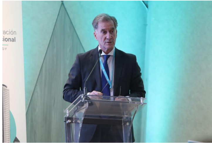
Francisco Jiménez-Villarejo, Fiscal de Sala Cooperación Internacional de la Fiscalía General del Estado de España y representante de la Secretaría General de la Asociación Iberoamericana de Ministerios Públicos