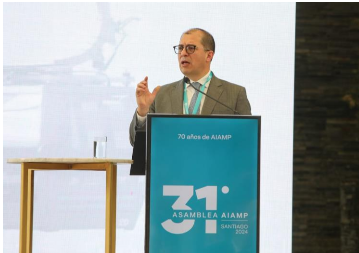
Francisco Barbosa Delegado, Fiscal General de la Nación de Colombia y Presidente de la AIAMP 2022-2024

El Fiscal General de la Nación de Colombia y Presidente de la AIAMP, Francisco Barbosa Delgado, instaló la XXXI Asamblea General Ordinaria de la AIAMP que se está llevando a cabo los días 1 y 2 de febrero de 2024 en Santiago, Chile. En el acto inaugural también participaron el Fiscal General del Estado de España, Álvaro García Ortiz, por parte de la Secretaría General de la Asociación, y el Fiscal Nacional de Chile, Ángel Valencia Vásquez, anfitrión de la Asamblea General.